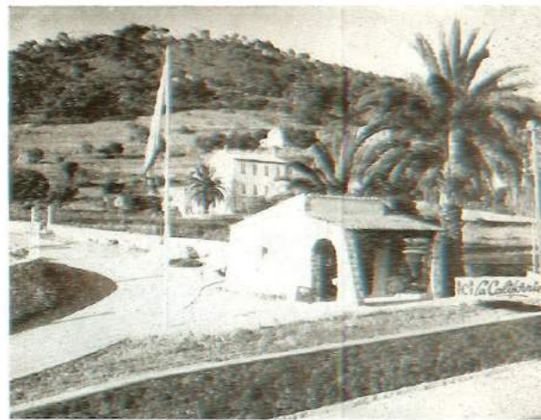
Entrée du morcellement résidentiel LA CALIFORNIE VAROISE

ORGES, Immeuble St-Nicolas 34, rue François-Fabré TOULON