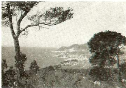
Vue sur le Port de CARQUEIRANNE